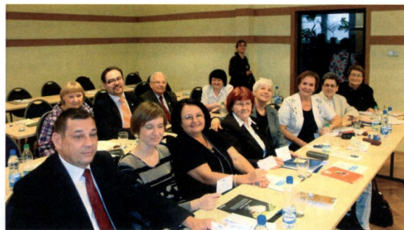
Przedstawiciele wielkopolski na krajowym zjeździe delegatów SBP