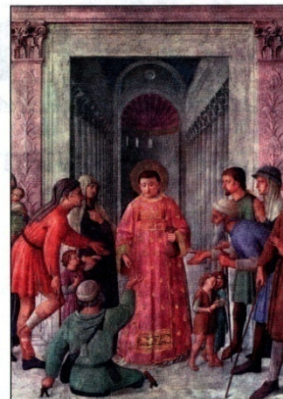
Rozdawanie jałmużny przez św. Wawrzyńca (fresk Fra Angelico w Muzeum Watykańskim)