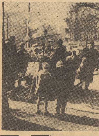
WIOSNA, wiosna w każdym miesiącu. W Szczecinie też. Widać to najlepiej na ulicach, które zapełniły się wiosennymi strzałami coraz liczniejszych spacerowiczów. Jako że Szczecin to miasto młodzieży — pełno na ulicach zakochanych par, młodych mamus, popychających dziecięce wózki... Przeklepek na pl. Zwycięstwa, które wysypały ze swoich kieszonek cale bogactwo dziecięcych zabawek — grzecholek, maskotek, świdełek. Mimo, że nie są to dzieła sztuki (często wręcz odwrotnie) powstają one jak widac murywane.

DZIS wypłynął z Gdańska w dziewięciorobny rejs statek PZM — m/s „ANDRZEJ BOROWY”, zbudowany w Stoczni im Komuny Paryskiej w Gdyni. Jest to jedynostopniowa 1 254 DWT wzmocnionymi lodowymi, przeznaczona do obsługi linii fińskiej. W inauguracyjnym rejsie statek zawinął do Helsinek.