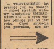
— TRZYDZIEŚCI lat pracuje już na walcach — mówi szarżnik walców Wiadysław SMIESZKIEWICZ — a tych walców planuję już od 1947 roku. Choć sytuacja jest poważna, nie są

TRZYDZIEŚCI lat pracuje już na walcach — mówi szarżnik walców Wiadysław SMIESZKIEWICZ — a tych walców planuję już od 1947 roku. Choć sytuacja jest poważna, nie są