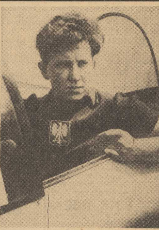
Edward Ochab, sekretarz KC PZPR

WARSZAWA PAP. Dnia 6 godz. 10 rozpoczęły się obrady XII Plenum Komitetu Centralnego PZPR. Na porządku dziennym sprawy zwiększenia inwestycji w rolnictwie i zapewnienia dalszego wzrostu produkcji rolnej. Obrady zagalę i sekretarza KC PZPR Władysława GOMULKA. Przemówienie wprowadzające wygłosił członek Biura Politycznego KC PZPR Edward OCHAB. Obrady trwają.