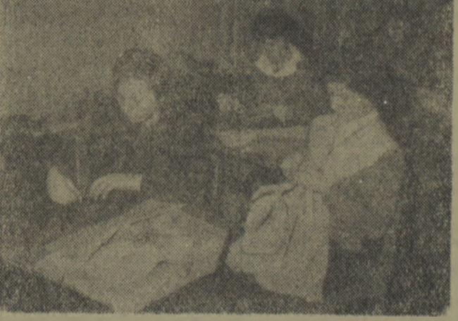
Spółdzielca Pracy „Konfekcja” w Toruniu systematycznie szkoli nowe kadry mistrzów-krawców. Na zdjęciu: ćwiczenia praktyczne.

Proletariusze wszystkich krajów łączcie się!