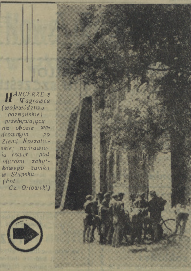
HARCERZE z Wągrowca (województwo poznańskie) przebywający na obozie wędrownym na Ziemi Koszalińskiej naprawiają rower pod murami zabudowanego zamku w Słupsku.