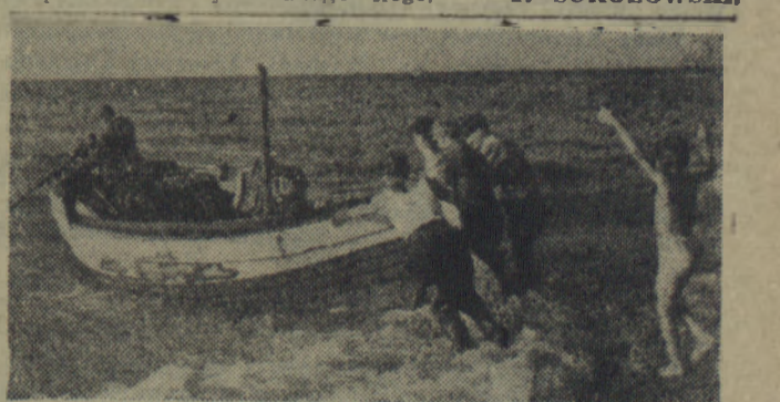
OSADA RYBACKA UNIESIY. Rybacy spychają łodzie rybackie na morze.