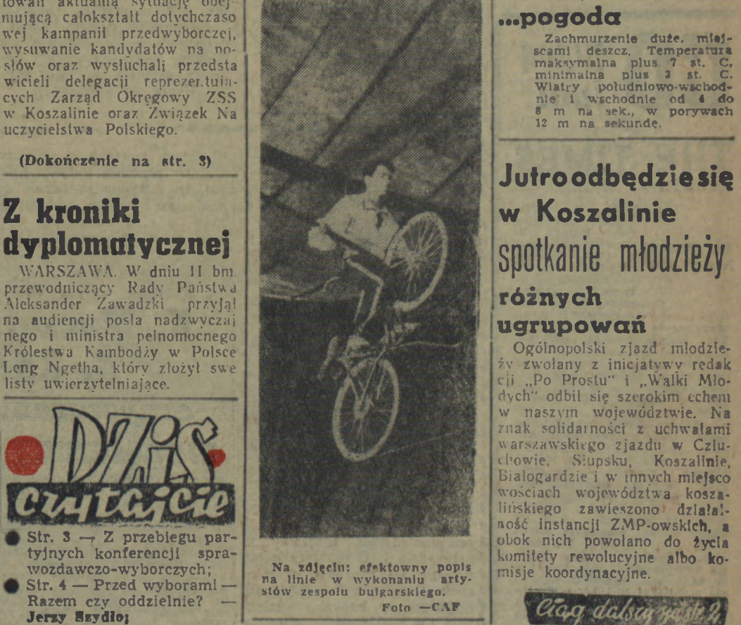
Na zdjęciu: efektywny popis na linie w wykonaniu artystów zespołu bułgarskiego.

Powstał Woj. Komitet Działaczy Katolickich