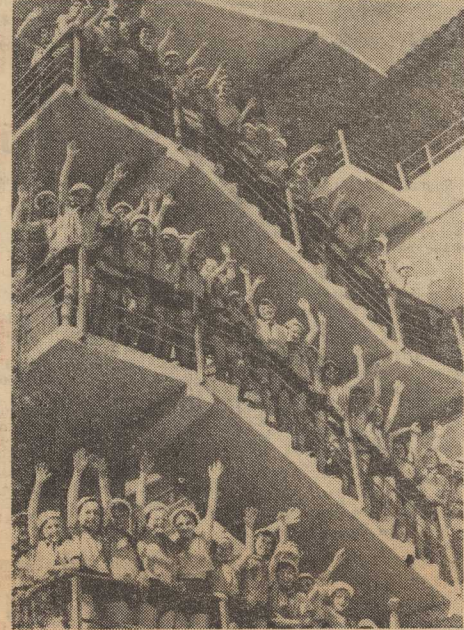
JEDNYM z najbardziej znanych w świecie jest obóz pionierski w Arteku nad Morzem Czarnym. U stóp Góry Niedźwiedziej artekowcy mają całe miasteczko, którego wszystkie urządzenia są przeznaczone dla pionierów. Na zdjęciu: pionierzy na obozie w Arteku.