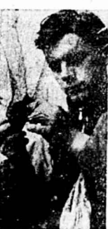
CODZIENNY OBCHÓD młodego ornitologa. Wydobytę z siatki ptaki są obrabowane i wpisywane do księgi rejestracyjnej.

W Górkach Wschodnich, małej wiosce rybackiej nad Wilną, niedaleko od Gdańska — Instytut Zoologiczny Polskiej Akademii Nauk zajął w 1958 roku swoją pierwszą Stację Ornitologiczną. Terenem dowiadzeń naukowych jest rezerwat ptaki w wyspie z rozległym iestorem odgródnionym od zatoki morskiej wąskim pasem lasu. Aparatura pomiarowa oraz wszelkie przyrządy naukowe znajdują się w nowo wzniesionym budynku stacji.