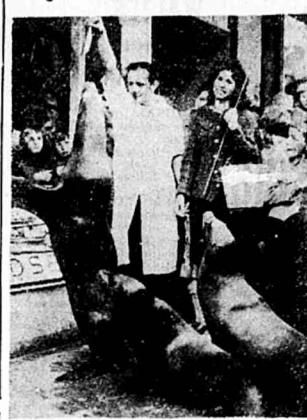
DO TEGO MIASTECZKA duńskiego przyjechał cyrk, którego atrakcją są tresowane fokki.

Pomyślna dyrekcja w tym czasie spaceruje po mieście — jak widzimy to na zdjęciu — fokki są wesołe i skłaniają się do zabawy.