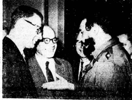
Na zdjęciu: Władysław Gomułka w rozmowie z Fidelm Castro w czasie przerwy do obradach.

NOWY JORK PAP. W przemówieniu wygłoszonym na wczorajszym posiedzeniu Zgromadzenia Ogólnego NZ Władysław Gomułka jako szef delegacji polskiej podkreślił na wstępie, że udział w tej sesji jak wielu szefów rządów i czołowych przywódców powojennych państw dowodzi przede wszystkim powagi sytuacji między narodowej.