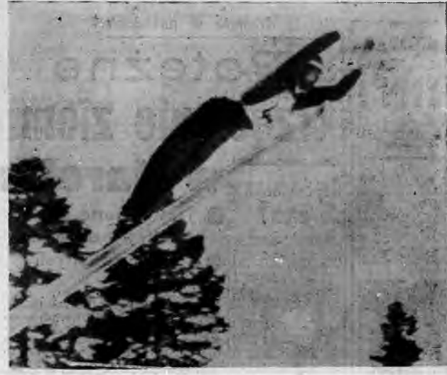
WZNIOSŁA IGROZKA OLEMPICKIE W SQUAW VALLEY ZAKOŃCZONE

Na zdjęciu: brygady in-żynków pracują przy budo-wle osiedla mieszkaniowe-wo w Szczecinie. Junacy et-ty sbeżyla ładnego tachu. W hufcach oprócz pracy, młodzi et ma możność ukon-czenia szkoly podziwowej, a Szczeciñie zdobywa przy-gotowanie do pracy w bu-dowlance.