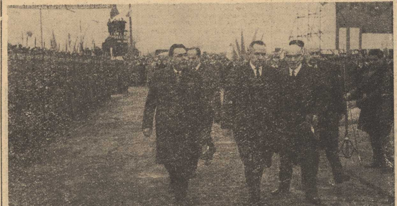
Na zdjęciach: U góry: L. Breżniew, W. Gomułka i J. Cyrankiewicz przechodzą przed frontem kompanii honorowej na Dworcu Gdańskim w Warszawie, U dołu: Na trasie przejazdu.

WASZYNGTON PAP. W poniedziałek doszło do nowych starć policji z Murzynami w stanie Alabama. W mieście Camden podczas akcji na maszerującą grupę około 50 Murzynów policja użyła gazu łzawiącego oraz bomb dymnych. Incydent ten był jednym z wielu, które tego dnia zdarzyły się w różnych miejscowościach Alabamy. Aresztowano 11 Murzynów.