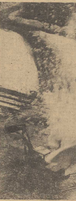
Uwaga na spadające z dachu sopele i zwały śniegu.

„Uroda” planuje także urządzenie samoobsługowego zakładu dla kobiet. Czekamy. (a2)