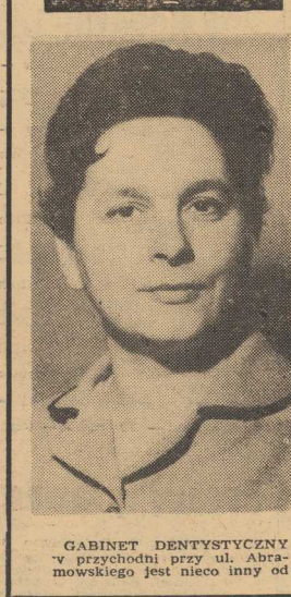
GABINET DENTYSTYCZNY w przychodni przy ul. Abramowskiego jest nieco inny od