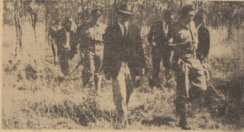
Silą rodezyjskich rasistów jest ich armia — nieliczna, ale znakomicie wyekwipowana i wyćwiczona.

W odległości 800 km na zachód od Kairu leży oaza, której nazwa brzmi „Pariz“.