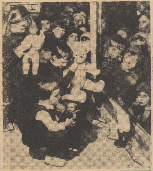
JAK ZWYKLE w grudniu, kiedy to wykupujemy zwiększone zainteresowanie zakupem różnorodnych upominków, handel stara się pomysłowo zareklamować posiadane towary.

Ważne jest, że w tym czasie, gdy w naszym mieście, w związku z wyjątkowo wysokimi temperaturami, woda w kranach jest bardzo ciepła.