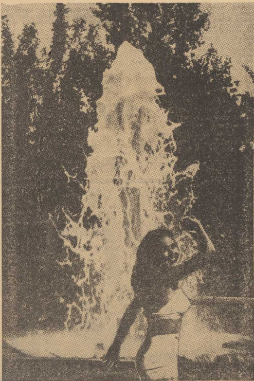
ZRÓDŁO S-3 leczniczej mineralnej wody w Dudincach.