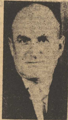
W Wiedniu określa się Klauza jako człowieka, który sporą część swojej uwagi kieruje na zacieśnianie kontaktów politycznych i handlowych z krajami socjalistycznymi.

OBECNY kanclerz Austrii dr Josef Klaus, jest szeroko znany w swej ojczyźnie i umiłowana Alp. Kocha góry i sam uprawia wspinaczkę.