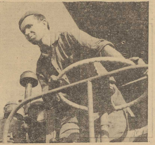
STATKI NA WYJŚCIU: M/S „INA” — do Londynu z dronbica. S/S „SOLDEK” — do Danii z wędem.

STATKI NA WEJŚCIU: M/S „NIMFA” — z Finlandii z dronbica. S/S „MARBORK” — z Danii pod balastem.