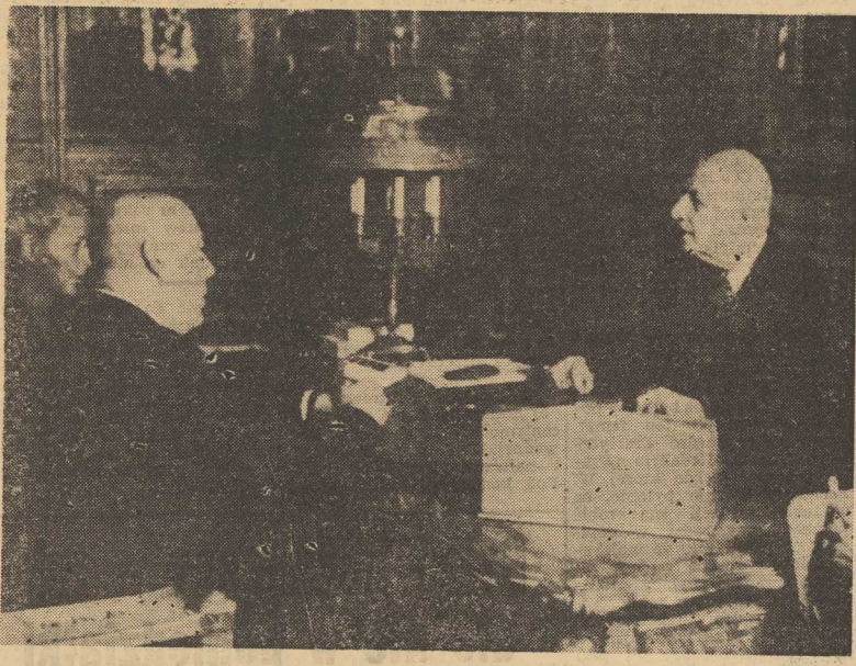
De Gaulle — Cyrankiewicz. 10 BM. prezydent Republiki Francuskiej — Charles de GAULLE przyjął w Pałacu Elizejskim premiera Polskiej Rzeczypospolitej Ludowej — Józefa CYRANKIEWICZA.

Rozpoczął się sezon polowania na... torbacze. Dwadziesiątka żywych kangurów wyłazła ostatnio z Australii do Anglii, gdzie będą służyć eksperymentom z nowymi lekami przeciwko przyszycku.