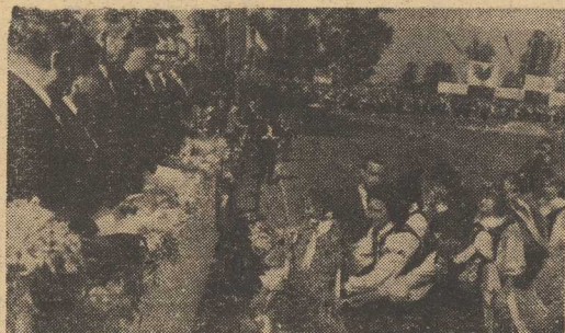
PRZODOWNICE składają wieńce i plony przed trybuną honorową.

„Polska i Francja mają wspólne troski...”