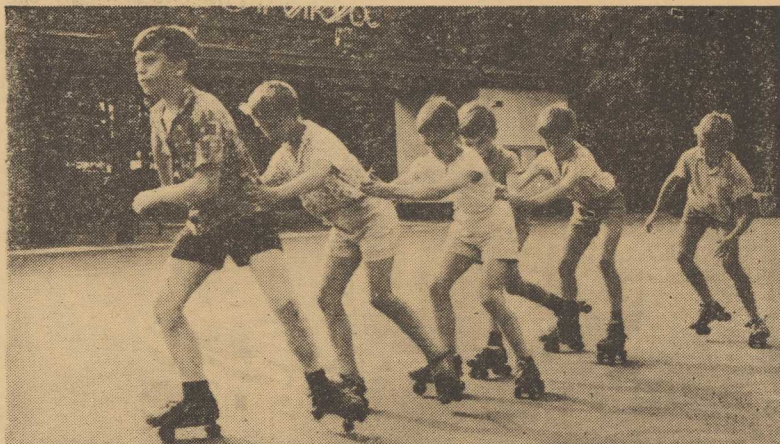
W WARSZAWIE przy ulicy Rozbrat — Ognisko TKKF „Syrenka” prowadzi naukę jazdy na wioślach własnych lub wypożyczonych za drobną opłatą (3 zł za godzinę). Czy nie warto by spróbować także i w Szczecinie?