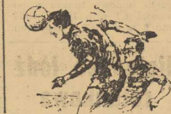
LECH BYŁ GROŹNY