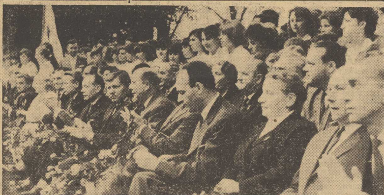
Na zdjęciu: minister Tułodziecki w otoczeniu przedstawicieli władz partyjnych i państwowych naszego województwa i miasta podczas uroczystości inauguracyjnej nowo rok szkolny.

NOWY JORK. Komisja energii atomowej USA przeprowadza w Ardzie na poligonie doświadczalnym w Newadzie kolejną podziemną eksplozję atomową. Jest to już 18-ty wybuch ładunku atomowego w USA w tym roku.