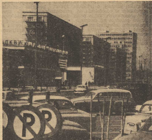
Duma berlińczyków: Karl Marx Allee.