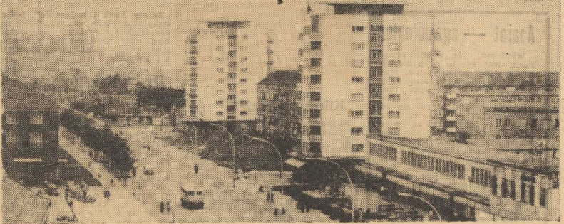
Energowska Nowa Huta — Eisenhüttenstadt. Na pierwszym planie handlowe centrum miasta. W tle kombinat.

Próbując bilansować minione dwudziestolecie w NRD, trzeba oczywiście widzieć nie tylko pozytyw. Tak zresztą jak czynią to zarówno szary obywatel republiki jak i ci, którzy wzięli na siebie w niełatwych przecież warunkach trud kierowania pierwszym demokratycznym państwem niemieckim.