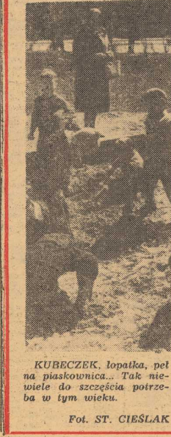
KUBEKZEK, łopatką, peł na piaskownicy... Jak cię widzą...