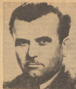
GEORGIJ TRAJKOW — przewodniczący Prezydium Zgromadzenia Narodowego Bułgarii.