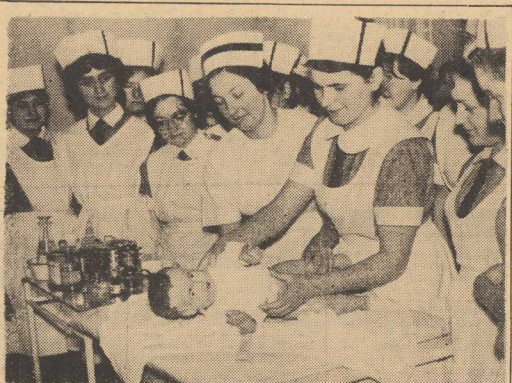
600 DZIEWCZĄT uczy się trudnego i odpowiedzialnego zawodu w Szczecińskim Ośrodku Szkół Pielegniarstwa w Połozyni przy pl. Orła Białego...