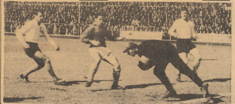
TEJ okazji Kielec nie wykorzystali...