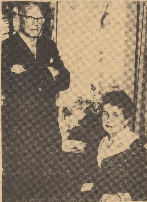
PREZYDENT FINLANDII dr Urho Kekkonen przybywa do Polski z małżonką z oficjalną wizytą w dniu 3 marca br.