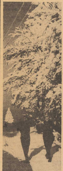
W drodze na Szynielnię.

W jedynkach mężczyzn pierwszy był Zukowski (Olsza).