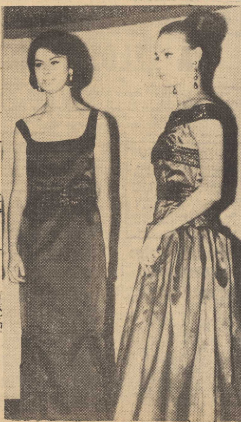
Dnia 7 bm. w Warszawie odbył się pokaz mody karna wawowej zorganizowany przez DOM MODY EWAT...