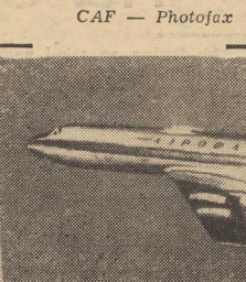
NOWY radziecki samolot pasażerski „TU-134”