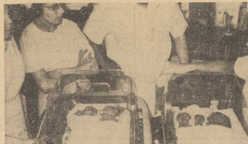
Na zdjęciu: młocznictwa w inkubatorach.

BANK ANGLII ogłosił wczoraj oficjalny komunikat, w którym donosi o uzyskaniu kredytu krótkoterminowego w wysokości 3 mld dolarów w celu podtrzymania funta szterlinga. Kredytu tego zgodził się udzielić centralne banki 11 krajów Europy Zachodniej, Ameryki Północnej i Japonii.