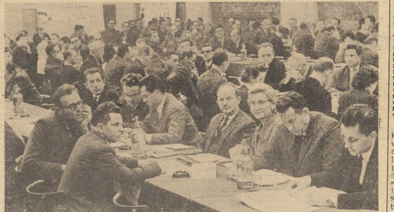
Na sali obrad