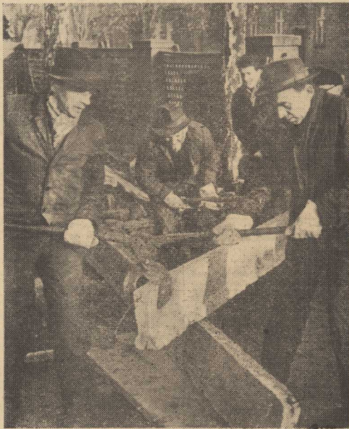
Na zdjęciu: pracownicy MPRB-1 przy trasporcie helek stropowych.