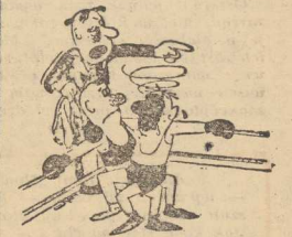
— Przecież tam jest twój narodził...!

1. ZSRR — 11 pkt., 2. NIEMCY — 8 pkt., 3. RUMUNIA — 7 pkt. — Utrzymuje się więc status quo z Rzymu, tylko nieco słabiej Węgry.