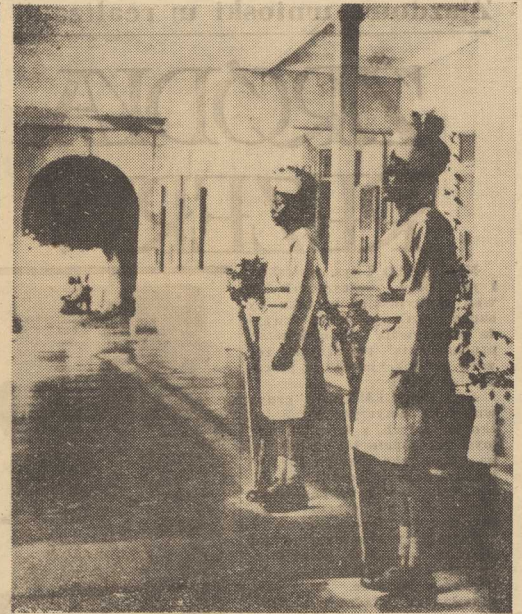
Obiektywem przez świat

Po 6 latach od dojścia do władzy w Sudanie generała Abbouda, który w 1958 roku dokonał puczu wojskowego, ludowa rewolucja obaliła obecnie juntę. Garska gene-