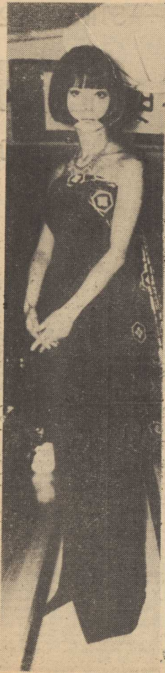
„OBI” — model sukni wieczorowej z brokatu, używanego na tradycyjne kimono. Suknię projektowali doradcy cesarskiej w japońskiej w dziedzinie mody.