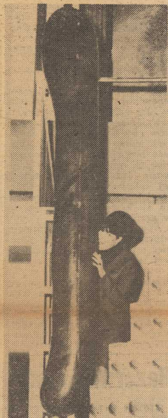
Ogromnych rozmiarów serdelek przyciąga wzrok zwiedzających wystawę hotelarstwa i artykułów spożywczych w Berlinie zach. Znalazła się nawet aniatorka, która chciała spróbować tego specjalu. Niestety, okazało się, że jest ona niejadłana.

Rozmowy von Hassela WASZYNGTON. Bański minister obrony von HASSEL kontynuując w Waszyngtonie rozmowy na temat projektowanych wielostronnych sił nuklearnych NATO.