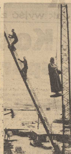
Osiem figur z brązu, zdobionych Falac Sztokholmski, po przecięciu renowacji wróciło na dawne miejsce...