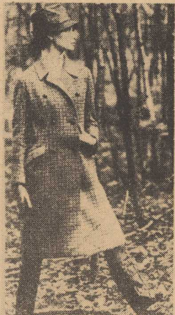
SPORTOWY plaszczyk o linii redingote z materiału w drobny kratkę. Kolnier i klapy z jednolitego materiału, zapieczone dwustronnie na skórzane guziki.

* PARYŻ. W dniu dzisiejszym rozpoczynają się w Paryżu pokazy kolekcji modeli wiosenno-letnich wielkich domów mody. Kolekcja domu mody Diora oczekiwana jest tradycyjnie w czwartek.