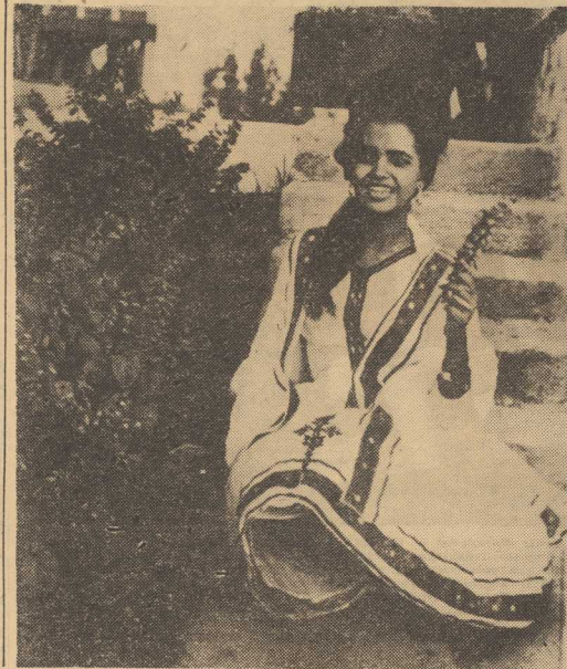
Na zdjęciu: typowa piękność w stroju narodowym.