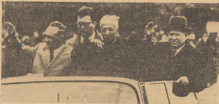
Prezydent Indii, dr S. Radhakrishnan, w towarzystwie N. Chruszczowa i A. Mikojana w drodze z lotniska wankowskiego.