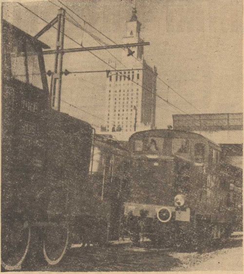
PKP przewożą obecnie prawie 97 proc. wszystkich ładunków w kraju. Przewozy kolejowe w roku ubiegłym czterokrotnie przewyższyły poziom z roku 1937. Świadczy to o bardzo wydajnej pracy 350 000 armii pracowników różnych służb kolejowych. PKP już nie zakupują parowozów. Całkowicie zostana one wycofane z eksploatacji ok. roku 1950. Wówczas to w Polsce ponad 600 km linii zostanie zelektryfikowanych, a pozostałe obsłużą trakcja spalinowa. Na zdjęciu: lokomotywy spalinowe na wystawie taboru i sprzętu kolejowego w Warszawie.