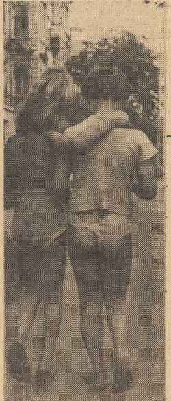
W tym wieku nawet mini-bikini nikogo nie szokuje...