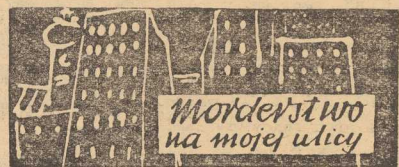
Przełożyła Irena DOLEŻAL-NÓWICKA

— Mówię to dlatego, że wczoraj wieczorem widziałem go w kapeluszu głęboko nasuniętym na czoło, siwe włosy miał ucięte i przez chwile go nie poznałem.