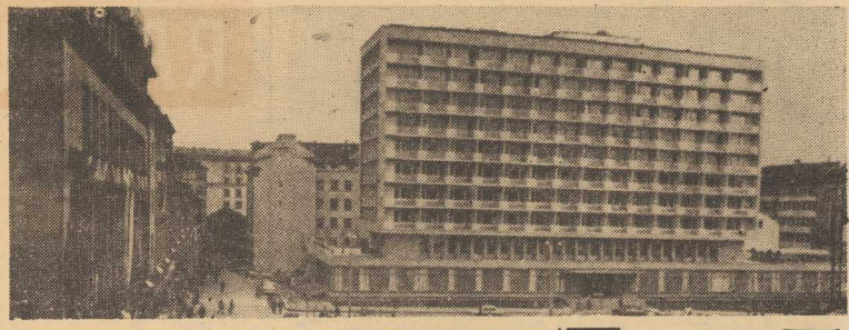
NA ZDJĘCIU: CENTRUM STOLICY Ludowej Bułgarii — Sofii. Nowoczesny hotel „Rila”. CAF

stycznej awangardy. Zwycięstwo narodu w dniu 9 września 1944 roku otwarło przed Bułgarią drogę do socjalizmu.