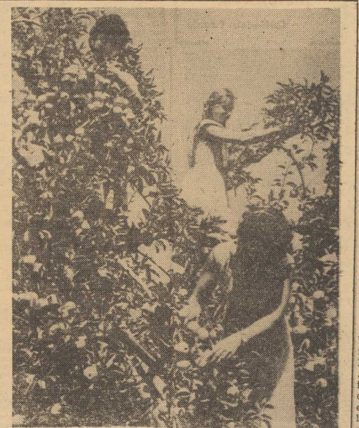
BULGARIA: Zbiór jabłek, które w tym roku pięćmiennie obrodziły.