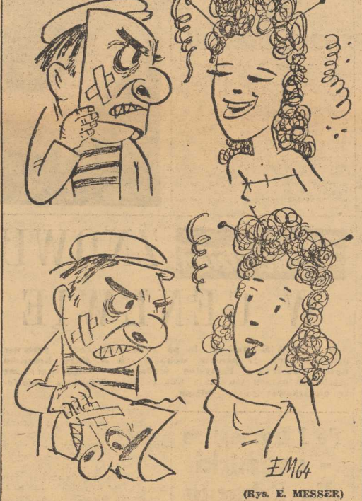
(Rys. E. MESSER)