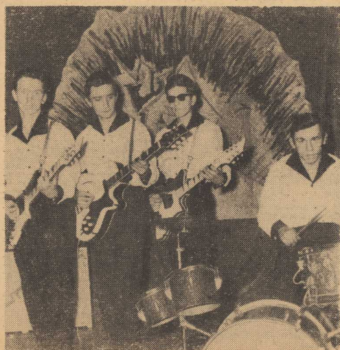
„Kropki” pozazdrościły „Filipinkom”

dzieni „Koryn” noszący się z zamiarem złożenia kierownictwu gastronomii oficjalnych podziękowań i wyrażeniu wdzięczności za troskę o doskonałe warunki... pracy. KAZ