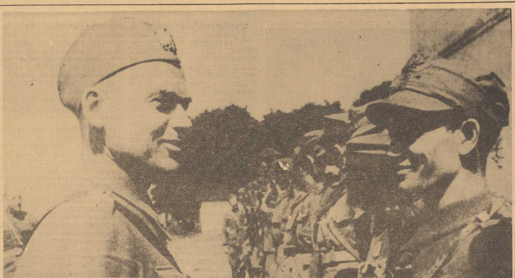
Aleksander Zawadzki w rozmowie z żołnierzami z grupy desantowej Batalionu Szturmowego przed odlotem do Polski.

Kubański minister spraw zagranicznych, dr Raul Roa w imieniu rządu i własnym złożył kondolencje na ręce ambasadora PRL w Hawanie.