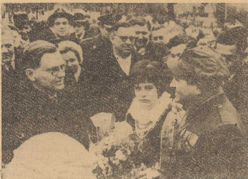
Kwiecień 1962 roku. ALEKSANDER ZAWADZKI w Trzcinie skąd witał chlebem i solą przez osadników wojskowych Ziemi Chojeńskiej, dawnych współtowarzyszy walk w Dywizji Kościuszkowskiej.

BOLESNA wiadomość o śmierci PRZEWODNICZĄCEGO RADY PAŃSTWA PRL, ALEKSANDRA ZAWADZKIEGO, nadeszła do Szczecina w słoneczne sierpnie we popołudnie. Ludzie wracając z pracy przystawali przed otwartymi oknami mieszkań, z których dochodziły słowa komuniaku radiowego. W sierpniowym słońcu stawały się tym bardziej żałobne. Tym bardziej żałobny stał się kir przepasujący narodowe flagi, opuszczone do pół masztu na budynkach naszego miasta, na dźwigach portowych i masztach statków. Tym większy, tym bardziej bolesny jest smutek nas wszystkich. Bo to, że Szczecin piękny jest w sierpniowym słońcu, że bliższy jasnymi oknami no wych domów i cieszy się codziennym pracowitym życiem — jest między innymi i JEGO, ZMARŁEGO PRZEWODNICZĄCEGO RADY PAŃSTWA zasługą. W depezy kondolencyjnej do Komitetu Centralnego PZPR, Rady Państwa PRL i Ogólnopolskiego Komitetu Frontu Jedności Narodu — Komitet Wojewódzki PZPR, w imieniu wszystkich członków partii i wszystkich obywateli województwa szczecińskiego stwierdził: