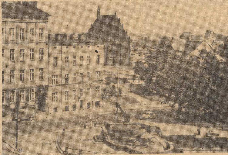
WIDOK z Czerwonego Ratusza

Z TARASÓW Czerwonego Ratusza rozciąga się malowniczy widok na fragment Starówki i portu. Okrętowa kotwica widząca przyjeżdżnych na placu przylegającym do dworca, jest symbolem Szczecina jako miasta portowego. (a)