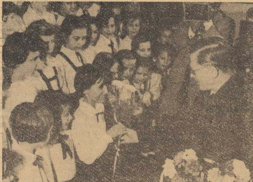
Kwiecień 1962 roku. ALEKSANDER ZAWADZKI wśród dzieci Szkoły Tysiąclecia w Szczecinie, przy ul. Witkiewicza.