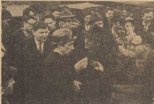
Wrzesień 1960 roku. Przewodniczący Rady Państwa ALEKSANDER ZAWADZKI w rozmowie z pracownikami szczecińskiej Stoczni.