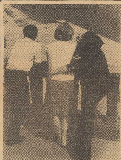
I KTOŻ zaprzeczy, że marynarze to ludzie rzeczowi, a w sprawach sercowych wykazujący istic burliwą inicjatywę.

W BIURZE OGŁOSZEŃ w budynku naszej redakcji są do odebrania 4 kciurki na kółku.