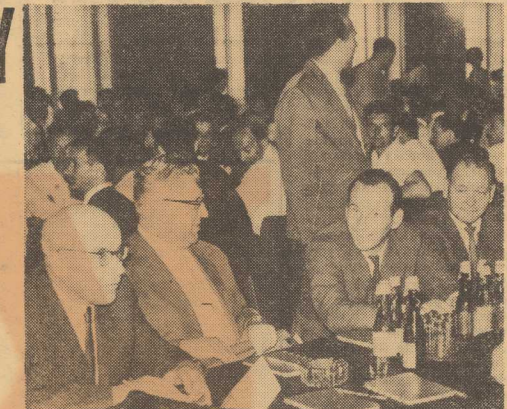
wszystkim w postawie członków partii. Każdego członka partii obowiązuje ta sama dyscyplina i ta sa

WŁ. GOMUŁKA PODKRĘSIŁ w związku z tym zadowoleniem, że ok. 600 twórców podpisało estrę protest w związku z kampanią „Wolnej Europy”. Dowodzi to, że zdecydowana większość tego środowiska zajęła słusne, obywatelskie stanowisko. Trzeba jednak zaznaczyć, że niektórzy literaci — członkowie partii protestu nie podpisali. Przyczyną słabości ideologicznej w niektórych środowiskach należy szukać przede