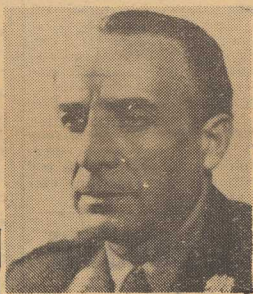
Marszałek Polski MARIAN SPYCHALSKI

WCZORAJ Marszałek Marian Spychalski — odwiedził pododdziały graniczne Pomorskiej Brygady WOP, interesując się ich służbą i działalnością. (w)