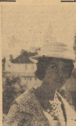
UROCZE PRAZANKI na tle swego miasta.