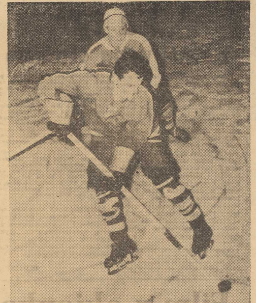
A OTO fragment wczorajszego meczu SKT — Budowlani Bydgoszcz.

PONAD 5 tys. widzów emocjonowało się pojedyńkiem WALI I PRZYBYŁY. W pierwszej serii Wala za piękny stylowy skok długości 91,5 m otrzymał notę 109 pkt. i objął prowadzenie. W drugiej kolejce Przy