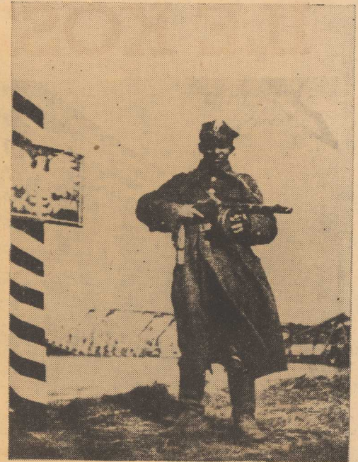
Straż graniczną nad Odrą objął żołnierz polski (kwie... cień 1945 r.)