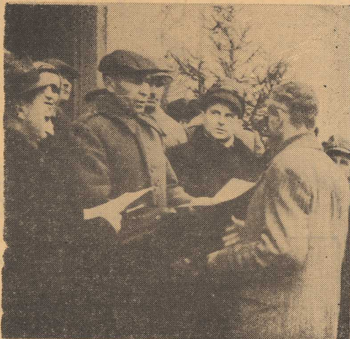
Reforma rolna: chłopcy z Krańnika (woj. lubelskie) otrzymują akty nadania ziemi.

Okupacyjne władze niemieckie wywoziły z Łodzi 40 tys. ton tkanin, surowców i półfabrykatów włókienniczych, 7 tys. ton żelaza, 7,5 tys. ton budulca itd. „Nie było nadziei — pisze historyk Władysław Lech Karwacki — na szybkie uruchomienie zdeprawowanego przemysłu i na stworzenie pomyślnych perspektyw dla łódzkiej plebszary”.