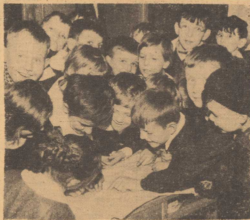
Na zdjęciu: w opracowaniu listu brała udział cała klasa.

DZIŚ o godz. 20.30, I sekretarz KW PZPR, poseł Antoni WALASZEK wystąpi przed kamerami szczecińskiej TV w okolicznościowym programie pt. „Pozdrowienia 1-majowe”.