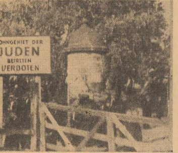
WOHNHEIM DER JUDEN BETRIEEN VERBOIEN

PARYŻ PAP. Na Morzu Południowo-Chińskim rozpoczęły się manewry SZA TO pod kryptonimem „Morski Diabeł”. Jak podaje Agencja France Presse z Singapuru, w manewrach bierze udział ponad 10 okrętów z 6 krążaków — Stanów Zjednoczonych, W. Brytanii, Australii, Nowej Zelandii, Filipin i Japończyków.