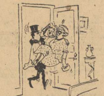
— No to teraz zacznij się szcze szczęście, Damianie!