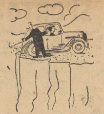
— Możesz śmiało cofnąć jeździe dobre 10 metrów, myśkolo!