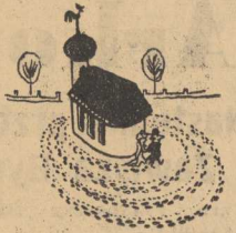
— No, zdecyduję się wreszcie Edwardzie...!