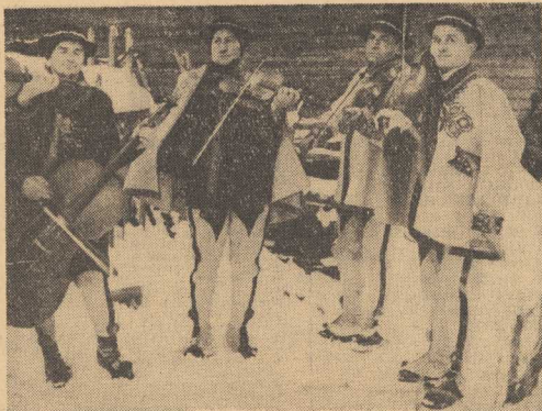
KAPELA GÓRALSKA CZEKA NA NOWO-ZEKCOW.