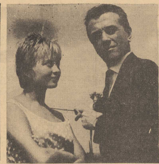
Przy „półczarnej” z reż. Janem Rybkwskim