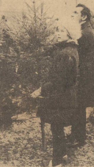
TO piękne drzewko wybrał tatuś, córka w zasadzie wybór aprobowała. Na „włoskiej” wyprawie” rożnada się jed nak po stoisku: a może znajdzie się jeszcze ładniejsza choinka? Tekst: (si)

PLACE i skwery uliczne zaszielone się świerkami. Liane stółska z choinkami (w tym roku nie zapomniano o peryferiach) obłożone są przez młodych i starszych — w tym wypadku wiek nie odgrąka rolę.